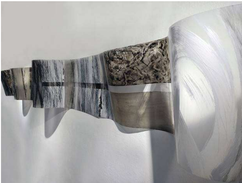
Milena Gregorcic: Linije in transparence XII , 54 x 360 cm, akril na prosojni foliji, 2019

Če gledamo z vidika procesov, ki se odvijajo v umetnosti, potem se po zaključku zgodovine moderne umetnosti in po postmodernizmu dandanes likovna umetnost ne odvija več v stiku s predhodnim obdobjem, pač pa se zdi, da se istočasno (tudi zaradi učinkov interneta) odvija v stiku z vsemi obdobji in se navezuje na sloge, predmete, motive, materiale, strategije in ideje iz mnogih obdobji na umetnostno-zgodovinski šahovnici. Priče smo preusmeritvi umetniškega raziskovanja od napredovanja in razvoja k nekemu enormno razvejenemu spraševanju. Umetniki ustvarjajo iz mnogih razlogov, od povsem osebnih do sistemskih. Glede na čas, ki nam je umetnikom na razpolago, in zbranost ter poglobljanje, ki smo ju zmožni doseči, da zadostimo svoji radovednosti, dobivamo svoje mesto v skupnosti. Naslov letošnjega Majskega salona (2019) se nanaša tudi na vse te razloge, predvsem pa sugerira témo, ki skuša vsaj zastaviti vprašanje o prihodnosti slikarstva po tem, ko in če je prebavilo in preseгло vplive digitalizirane podobe. Individualne prakse so edino sredstvo, ki lahko kaj takega izkaže. Podnaslov »Tematizacija slikarske umetnosti« se ne nanaša samo na slike, pač pa tudi na prakse, ki z drugimi sredstvi govorijo o pogojih slikarstva, in podobe, ki govorijo o slikarstvu skozi njegove prisposobe in kažejo na kriterije, po katerih so udeleženci razstave izbrali svoja dela.«