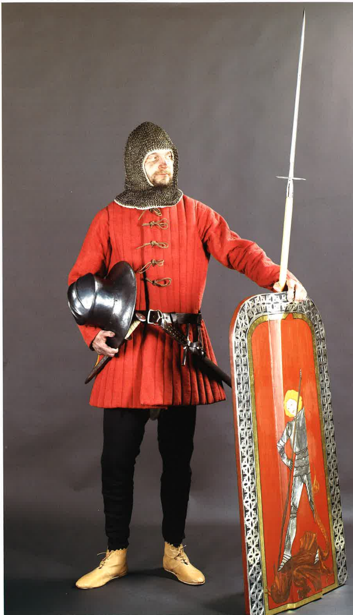
Slika 151. Vojak iz 15. stoletja - rekonstruirana podoba. 7