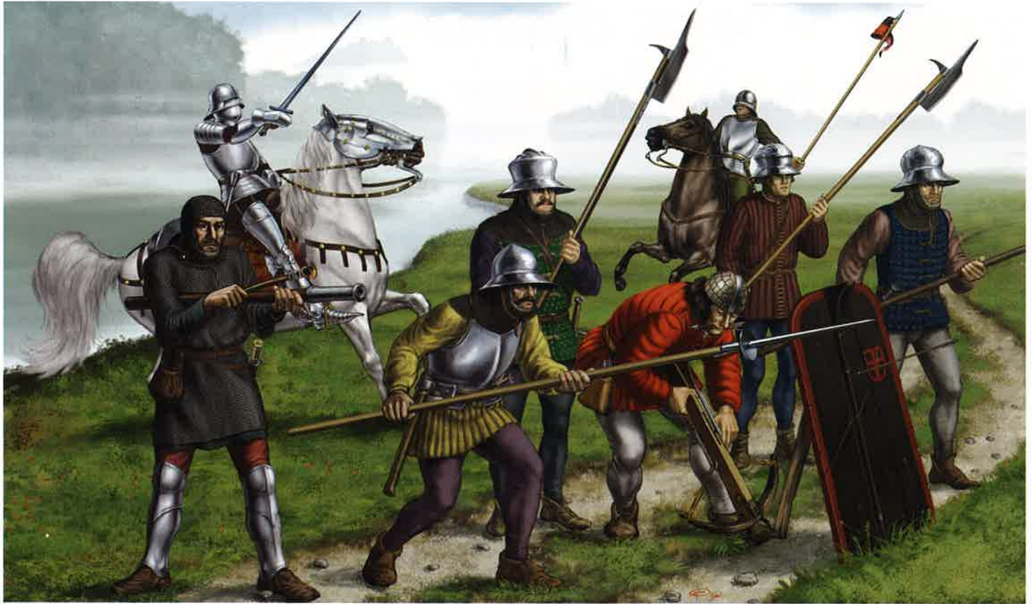
Slika 150. Skupina vojakov iz 15. stoletja. 6

določitev je le za posamezne vrste orožja in bojne opreme natančnejša, za večino pa dokaj splošna, največkrat na stoletje ali njegovo polovico.