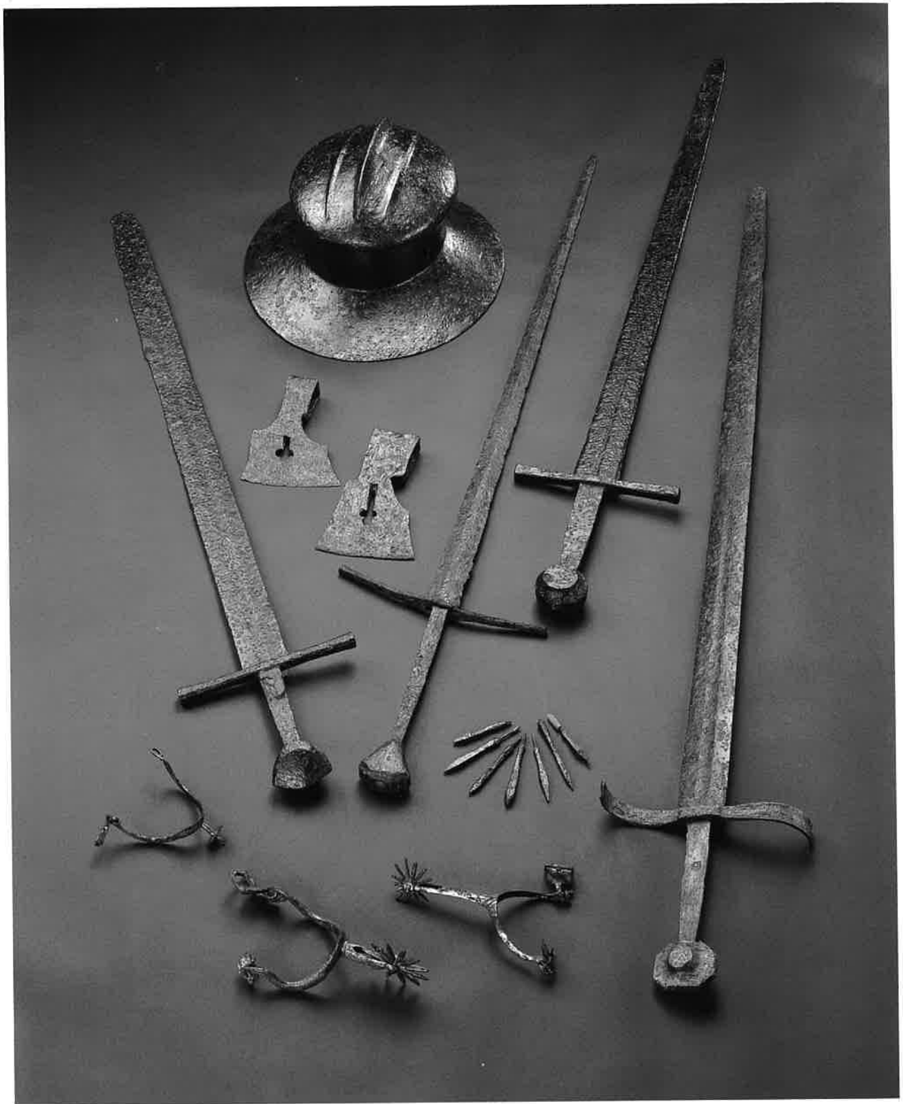
Slika 90. Orožje in bojna ter konjeniška oprema iz Ljubljance, 12.-15. stoletje