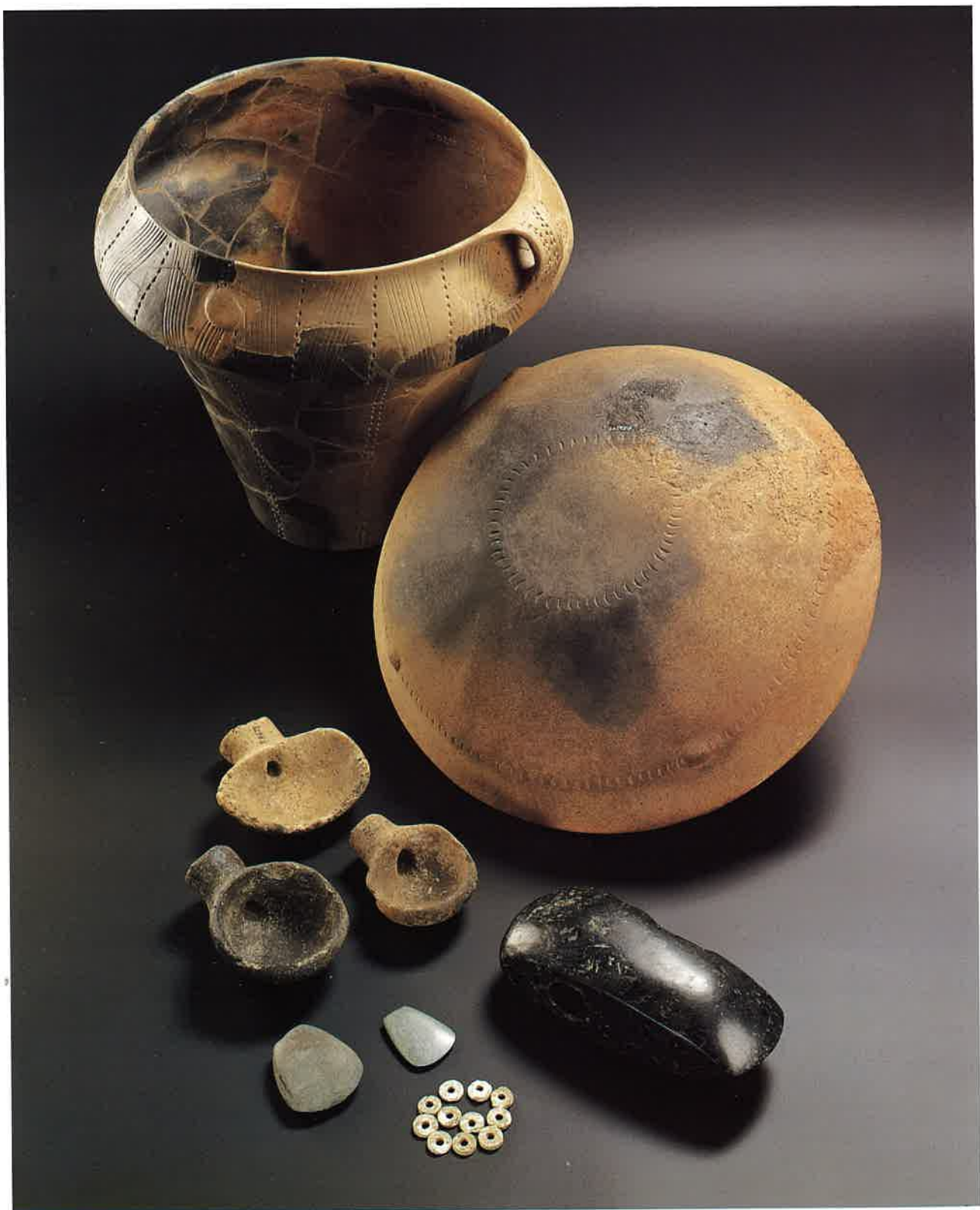
Slika 66. Izbrani neolitski predmeti iz osrednje Slovenije