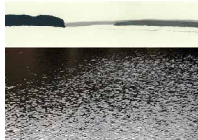
Karl Vouk, Čornica #2, 70 x 100 cm, 2015