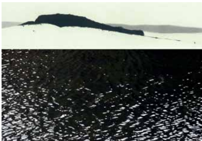
Čornica # 1, 70 x 100 cm

iz avstrijske Koroške, Rinkole/Rinkolach