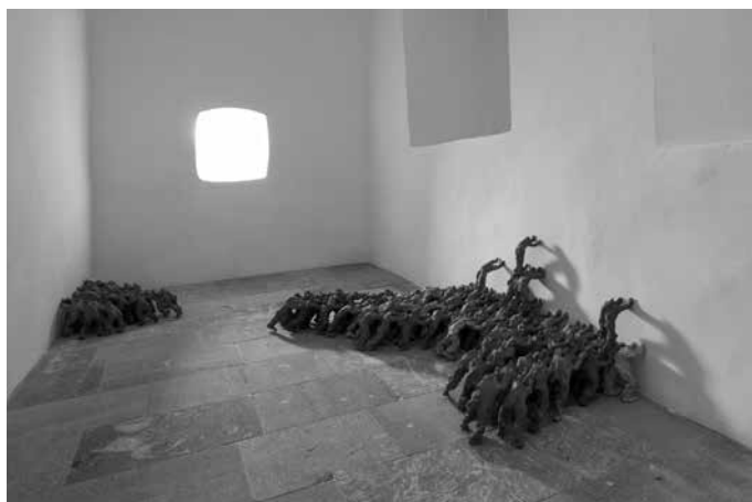
Sl. 4 – Z ničimer izzvani , 2019, keramika, dimenzije so prilagojene razstavnemu prostoru