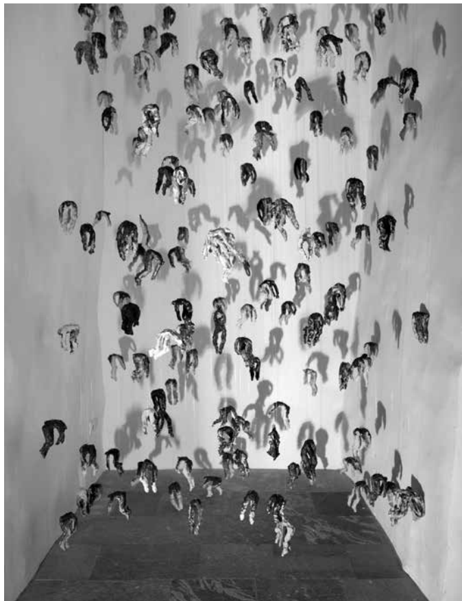
Sl. 2 – Oda nemoči , 2014, keramika, dimenzije so prilagojene razstavnemu prostoru