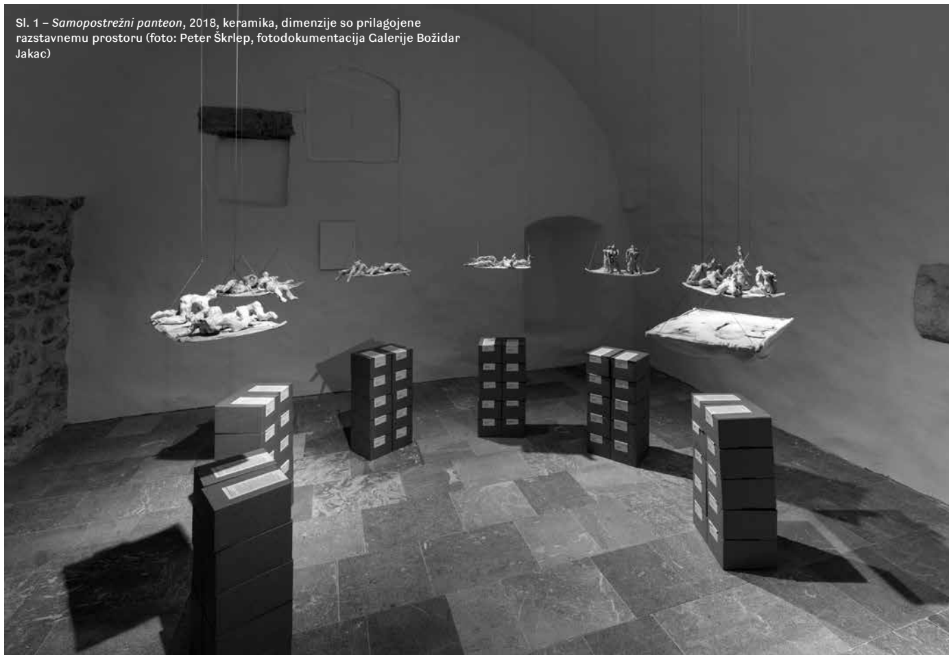
Sl. 1 – Samopostrežni panteon , 2018, keramika, dimenzije so prilagojene razstavnemu prostoru

Delo multimedijske vizualne umetnice Vere Stanković omogoča vpogled v današnje stanje duha, ki si prizadeva za stalni napredek. Ljudje so potisnjeni