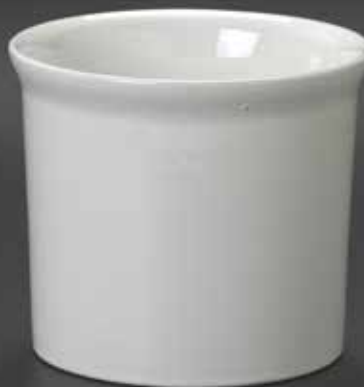
Sl. 8 – Lonec za rože, v. 15 cm, prva polovica devetdesetih let 20. stoletja, Dekor, Zbilje pri Medvodah, Narodni muzej Slovenije