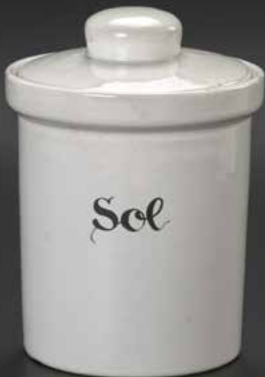
Sl. 7 – Doza, v. 18 cm, prva polovica devetdesetih let 20. stoletja, Dekor, Zbilje pri Medvodah, Narodni muzej Slovenije