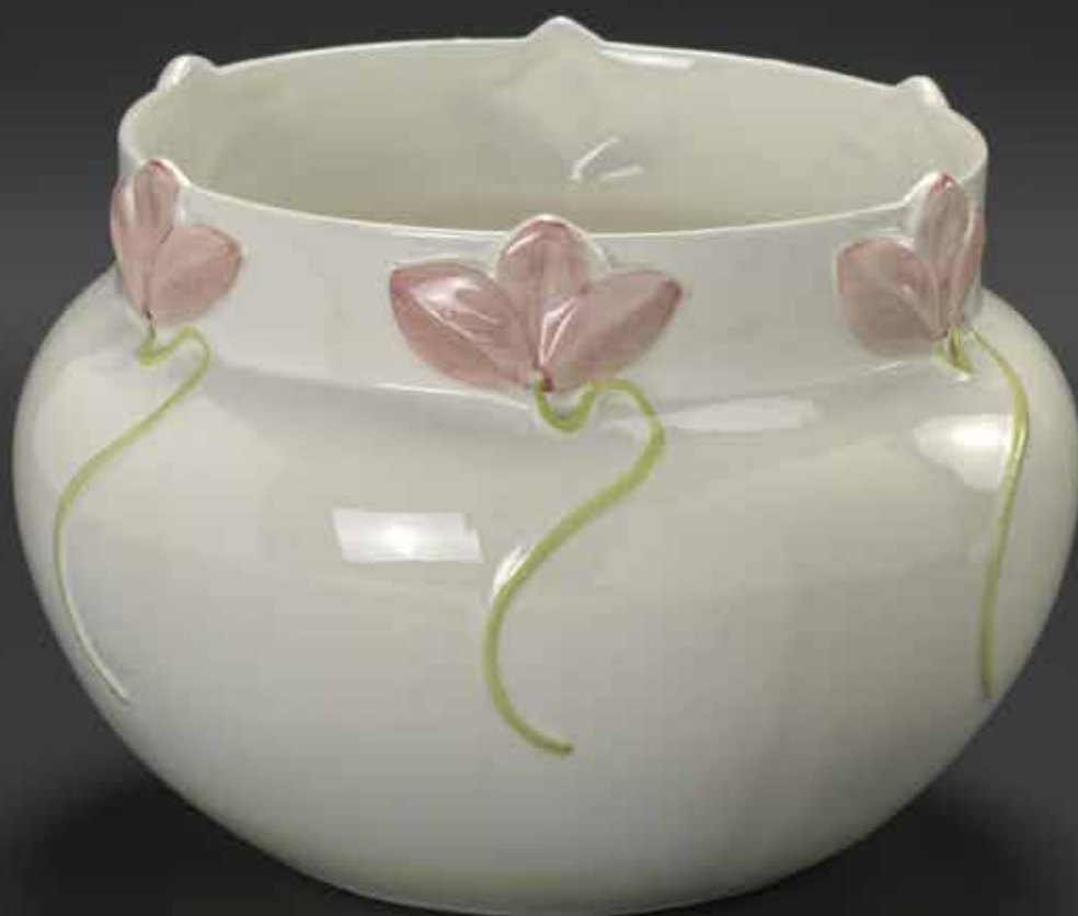
Sl. 18 – Lonec za rože, v. 18,5 cm, prva polovica devetdesetih let 20. stoletja, Dekor, Zbilje pri Medvodah, Narodni muzej Slovenije