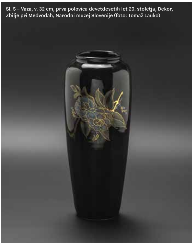
Sl. 5 – Vaza, v. 32 cm, prva polovica devetdesetih let 20. stoletja, Dekor, Zbilje pri Medvodah, Narodni muzej Slovenije