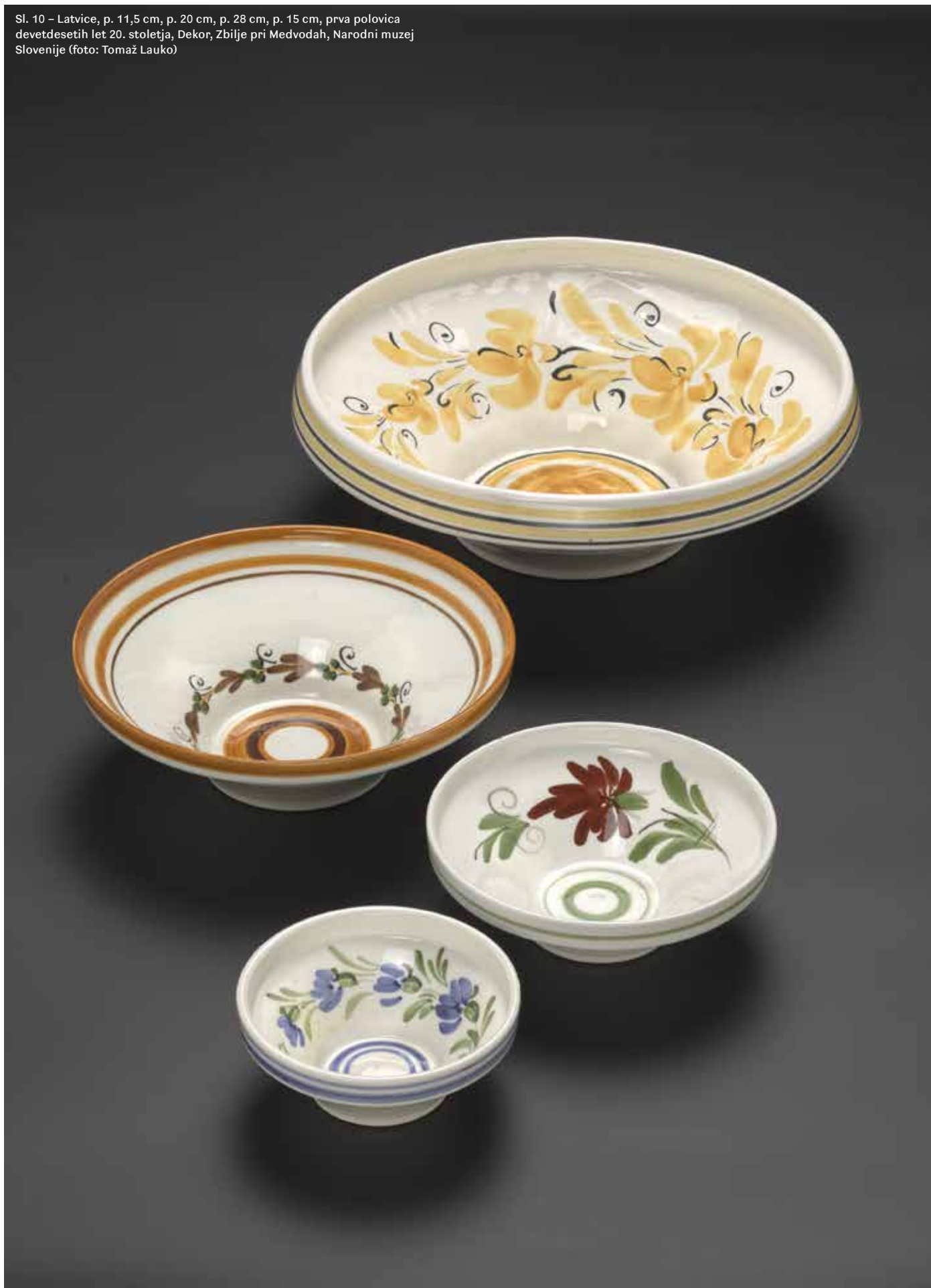
Sl. 10 – Latvice, p. 11,5 cm, p. 20 cm, p. 28 cm, p. 15 cm, prva polovica devetdesetih let 20. stoletja, Dekor, Zbilje pri Medvodah, Narodni muzej Slovenije