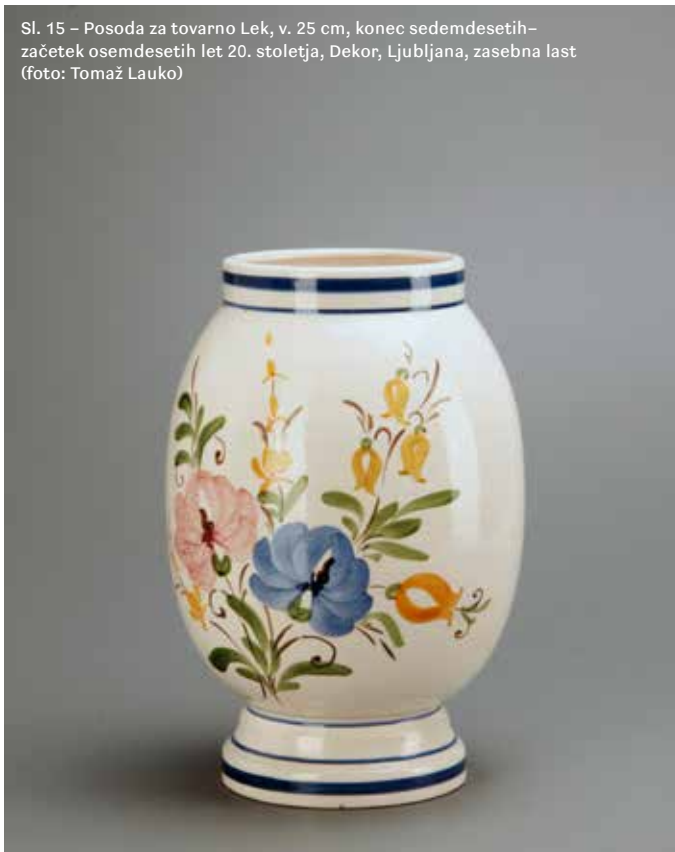
Sl. 15 – Posoda za tovarno Lek, v. 25 cm, konec sedemdesetih–začetek osemdesetih let 20. stoletja, Dekor, Ljubljana, zasebna last