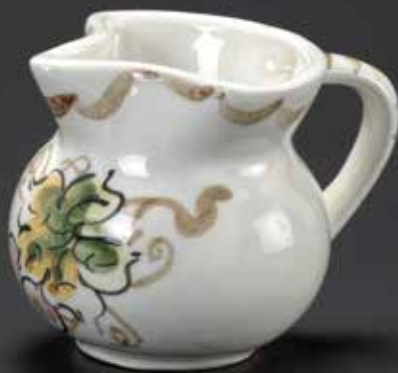
Sl. 12 – Ročka, v. 7 cm, prva polovica devetdesetih let 20. stoletja, Dekor, Zbilje pri Medvodah, Narodni muzej Slovenije