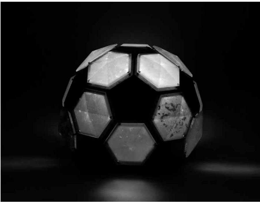
Sl. 3 – Svetilo »Izvor«, Danijel Nikolić (foto: Miha Benedetič)