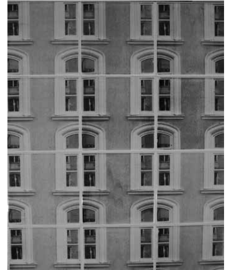
Sl. 5 – Peresa, Manca Mencin